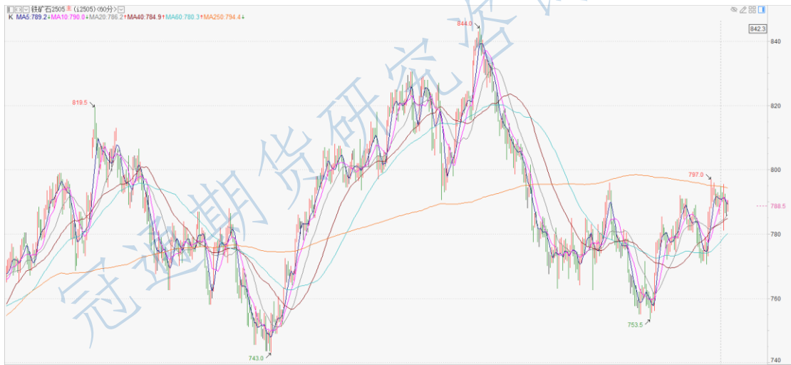
铁矿石 2505 小时 K